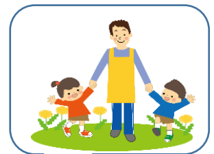
兄弟・姉妹が療育時間の間